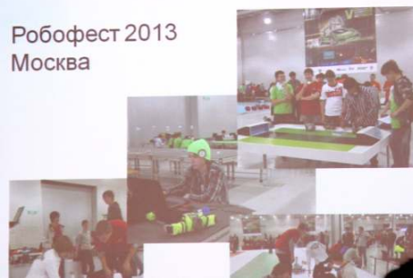
Робофест 2013 Москва

научные центры, поделились секретарми работы в наноцентре. Сначала нам рассказали о работе в летнем лагере ЛАД, потом