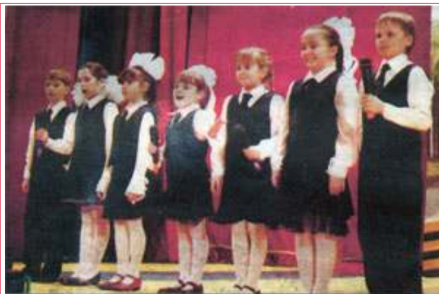
Юные жители Пашино поздравляют ракетчиков с Днем защитника Отечества.

Газета «Советская Сибирь» от 28.02.2008г.