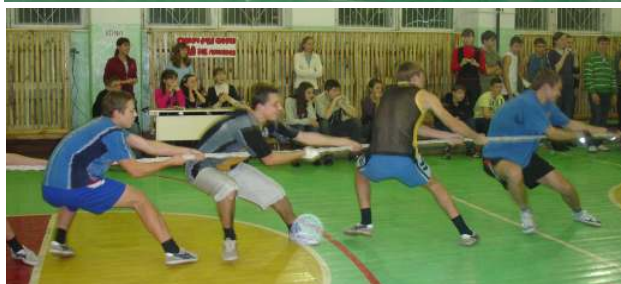
Перетягивание каната—дело непростое!