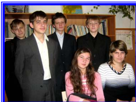
Команда-победительница 10«А» «ШИК-2»

Интеллектуальная игра по истории Калининского района проходила 16 октября в ДК «Заря». Наша команда «ШИК-2» состояла из шести человек: Пархо-