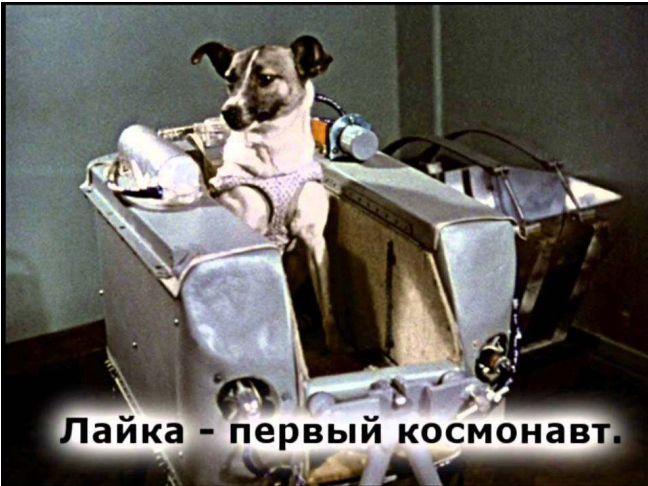
Лайка - первый космонавт.

Прежде чем человек полетел в космос, там побывали животные. Первой в космос отправилась собака Лайка в 1957 году. Лайка стала первым живым существом, отправившимся в космический полет. Она была запущена в космос 3 ноября 1957 году на советском корабле «Спутник-2» - 60 лет назад!