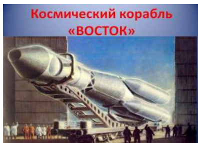
Космический корабль «ВОСТОК»

В первом полете важно было решить главную задачу: